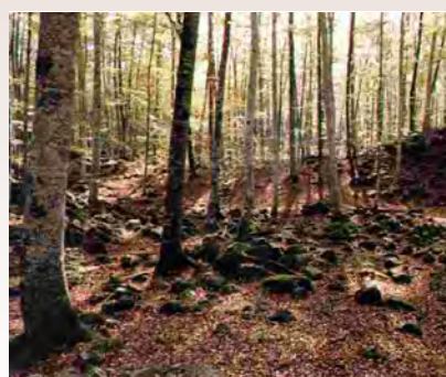
Centre de Documentació

L'itinerari pedestre núm. 2, senyalitzat i d'uns 30 minuts de durada, s'endinsa en aquest bosc de fags. L'aspecte del bosc és molt diferent segons l'època de l'any. La Fageda d'en Jordà es troba situada damunt la colada de lava del volcà del Croscat.