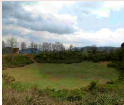
Camí Nou (Aneu d'Imaginatge d'Olot)

Un dels volcans més interessants del Parc Natural. A dalt, l'església de Sant Francesc, emmurallada durant l'ocupació francesa i reconstruïda l'any 1875. Les dues torres de guaita, bastides durant les guerres carlines, són excel·lents miradors d'Olot i de la zona volcànica de la Garrotxa.